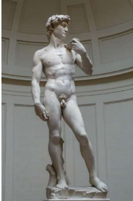
Resim 1. Michelangelo, Davut, 1501-1504, Galleria dell'Accademia (Floransa). Erişim adresi: https://tr.wikipedia.org/wiki/Davut_(Michelangelo)