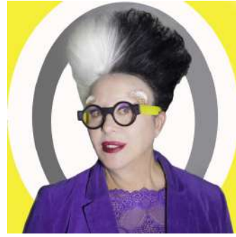
Resim 3. Orlan

Resim 2