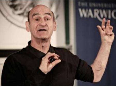
Resim 2. Stelarc

Orlan'ın bu konudaki düşünceleri, ilerleyen süreçte daha fazla keskinleşecektir. Sanatçı 55. Venedik Bienali'nde kendisi ile yapılan görüşmede insan türünü ölümlü kılan doğayı reddettiğini şu şekilde dile getirir; “Doğayı kabul etmiyorum, bizi ölüme götüren o ve dahası çökerten de o, bu bir işkence, berbat ve geri döndürülemez. Hiçbir şey yapamayız” (Marcoagostinelliartproject (Yapımcı). Liuzza (Video). (2014)). Sanatçının düşüncelerinde açık ve net bir şekilde görülen bu kabullenmeyiş te Gılgamış'ın ölümsüzlük arayışı arketipinin modern çağdaki yansımalarından birisi olarak görülebilir. Sanatçı kendi doğal bedenini kabul etmez, halihazırda sahip olduğu ile yetinmez ve kendi istediği şekilde onu biçimlendirir. En nihayetinde değişmez bir yazgı olan ölüme karşı bir görüş bildirir, onu bir hastalık olarak kabul eder ve tıpkı Gılgamış gibi buna karşı bir çare talep eder.