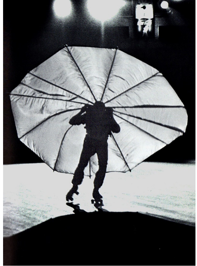
Resim 4. Robert Rauschenberg'in "Pelikan"

bir filmle belgelenmiştir ki bu deneyler kanatların açılıp kapanmasını, rüzgârda kontrol edilmelerini, gizleme ve açığa vurma biçimlerinin yanı sıra kanatların yayılmasını içeriyordu" (www.tinguely.ch 2019). Horn'un performansında da kanatlarının büyüklüğüne rağmen ayakları yerden yükselmektedir. Sanatçı 1980'li yıllarda çalışmalarında kendi geliştirdiği otomatları kullanmaya başlamıştır. Bu çalışmalar bedensel eklemlerden daha çok yerleştirme sanatı içerisinde değerlendirilebilecek kinetik sanat örnekleridir. Bununla birlikte sanatçının üretim eğilimleri bize tekrar göstermektedir ki; eğer bir yerde beden ve başka eklemlerin birlikteliği söz konusu ise ardından teknoloji ve makine kullanımı yorumlanmaya başlayacaktır. Horn da bu tarz eğilimlere sahip sanatçıların ortak özelliklerini paylaşır. Mina Roustayi'nin "Rebecca Horn'un Hassas Makineleri" isimli makalesindeki sözleriyle "O aletlerini Leonardo da Vinci ve Marcel Duchamp geleneğinde saplantılı bir şekilde belgeleyen bir simyacı, sanatçı – mucit, bir rönesans kadınıdır" ( https://msu.edu Roustayi).