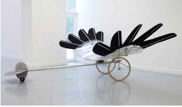
Resim 3. Panamarenko, "Kuzgunun Değişen Matrisi"

Değişen Matrisi isimli çalışması Letatlin 'i andıran, insanın kendi gücüyle uçabilmesinin yolunu araştırdığı çalışmalarından birisidir. Panamarenko 1970lerden sonra sırtı takılabilen ve insanın dikey olarak uçabilmesini sağlayacakmış gibi duran sırt çantası benzeri çalışmalar üretmiştir. Sanatçının çalışmaları ve eskizleri ilk bakıldığında Leonardo Da Vinci ve Tatlin'i hatırlatır. Bununla birlikte Panamarenko'nun eserlerinde Leonardo Da Vinci ve Tatlin'in gerçek hayatta işlevsel olması beklentisi ile eser tasarlama tavrını göremeyiz. Sanatçının yönelimi İkoros üzerinden bir çeşit modern sanatçı miti üretmek aşamasında kalır. Bu tavır karşılıksız kalmaz. 20. Yüzyılın kendi kişisel mitini üreten en bilindik sanatçısı olan "...Joseph Beuys, Panamarenko'yu Flugzeug isimli eserini Düsseldorf Kunstakademie'de sergilemek için davet eder" (www.artnet.com, 2019).