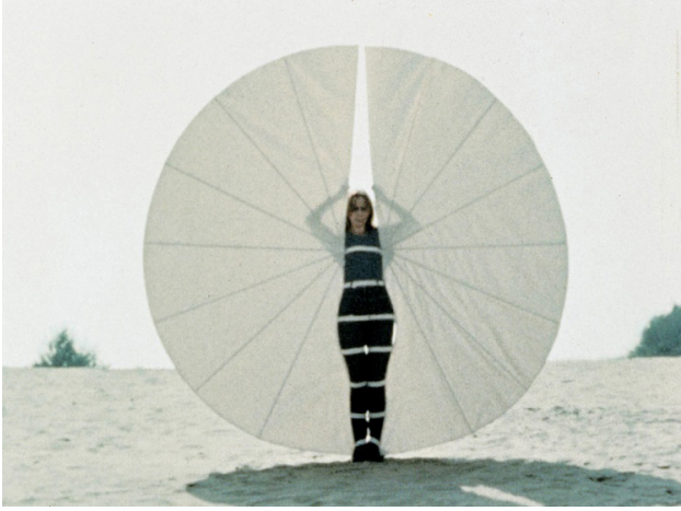
Resim 5. Rebecca Horn "Beyaz Beden Fanı"