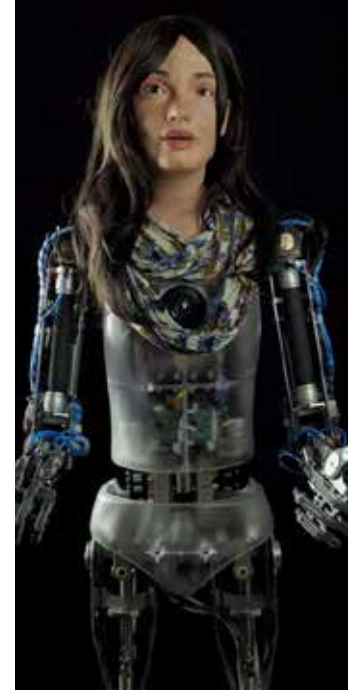
Görsel 3. Robot Ai-da