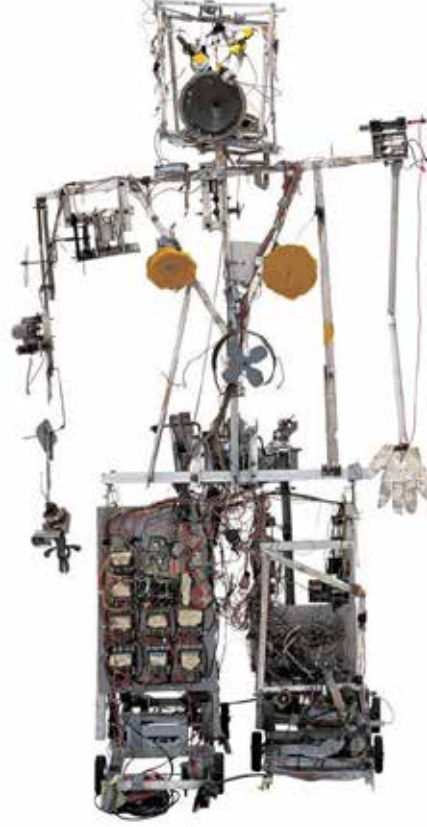
Görsel 1. Nam Jun Paik, “Robot K-456”, Boyut, yedek parçalar ve buluntu nesnelere, 1964, Zürih.